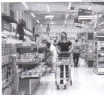
Especialistas analisam que a disparada do IPCA foi impulsionada pelo aumento dos preços dos combustíveis, energia elétrica e dos alimentos

Também contribuíram o aumento de itens básicos para as famílias, como alimentos, inclusive por alterações climáticas que afetaram plantio e colheita de diferentes produtos, além de persistente ruptura na cadeia global de abastecimento de insumos industriais, especialmente chips. Além disso, o resultado de 2021 foi influenciado pelo grupo de transportes, que apresentou a maior variação (21,03%) e o principal impacto (4,19 pontos percentuais) no acumulado do ano. Em seguida, vieram os segmentos de habitação (13,05%), que contribuiu com 2,95 pontos percentuais, e alimentação e bebidas (7,94%), com impacto de 1,68 ponto percentual. Os três responderam por cerca de 79% do IPCA de 2021.