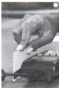
Entre os tipos de dívidas em situação de inadimplência em fevereiro, segundo a Serasa, 28,6% vêm de débitos com o cartão de crédito

Essa quantidade não era atingida desde maio de 2020, no início da pandemia. Somente em fevereiro, o número de inadimplentes subiu 0,54%. Cada brasileiro deve, em média, R$ 4.042,08. A estatística se baseia no fato de que cada número do Cadastro de Pessoas Físicas (CPF) tem, em média, 3,4 dívidas ati-