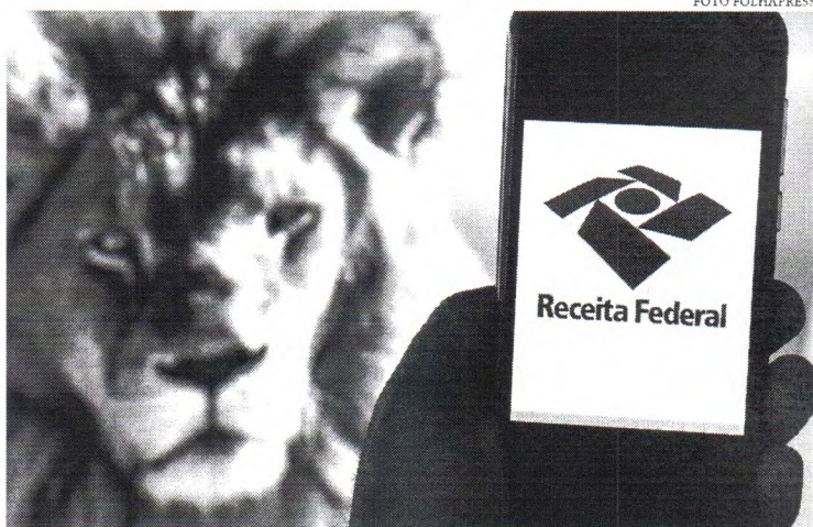
Nos primeiros quatro meses, a arrecadação alcançou R$ 743,2 bilhões, o que representa avanço de 11,05% pelo IPCA

índice. O Índice Nacional de Custo da Construção (INCC-M) registrou inflação de 1,49% em maio deste ano. A taxa é maior do que a observada em abril (0,87%) e menor do que a de maio do ano passado, quando o índice registrou taxa de 1,80%. Os dados foram divulgados pela Fundação Getúlio Vargas (FGV).