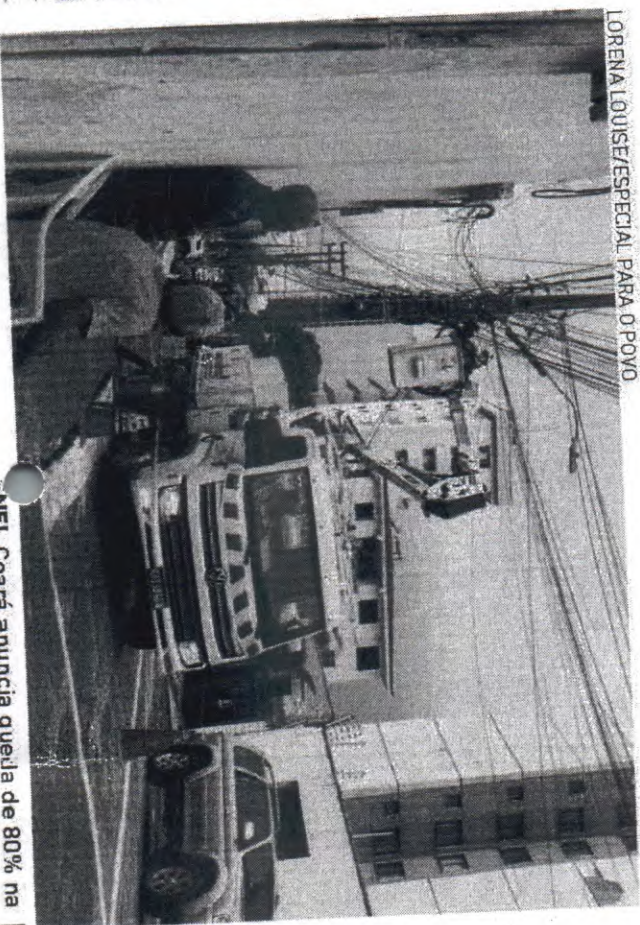
ENEL Ceará anuncia queda de 80% na incidência de falhas de energia no Carnaval