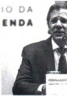
Pacote fará parte de uma medida provisória que deve ser editada pelo governo ainda em 2023