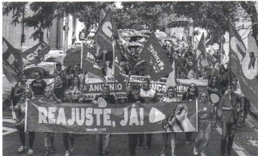
A paralisação dos professores está mantida, pelo menos, até a quarta-feira, 07

Os professores da rede municipal de Fortaleza continuam se manifestando na cidade pela implementação do reajuste salarial de 10,9%. Após rejeitarem, por unanimidade, a proposta apresentada pela Prefeitura no final da semana passada, os profissionais do magistério marcharam nesta segunda-feira, 05, pelas ruas da capital cearense desde a coordenadoria da Coordenadoria de Gestão de Pessoas (Cogep) até a Secretaria Municipal de Educação (SME). "Nossa luta é por direitos e dignidade na educação. Juntos, somos fortes e vamos continuar firmes até alcançarmos nossos objetivos", escreveu o Sindicato União dos Trabalhadores em Educação de Fortaleza (Sindiute) em uma publicação feita nas redes sociais.