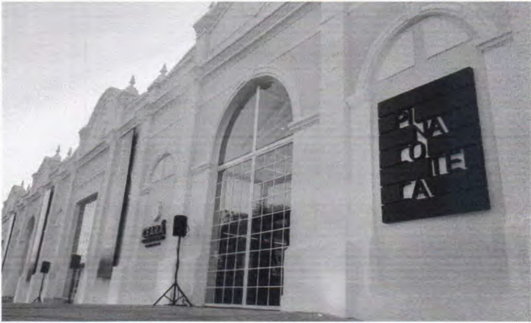
A aula vai abordar as produções artísticas nos momentos de maior resistência de meados dos anos 1960 em diante

A instauração da ditadura civil-militar brasileira completa 60 anos em 2024. O período durou 21 anos (1964-1985) e deixou marcas na história. Apesar do processo de abertura e redemocratização, a consolidação de