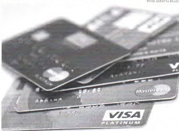
A regra proposta pelos bancos é um desdobramento do que a Lei do Desenrola já estabelece

Os bancos propuseram limitar os juros para todos os financiamentos vinculados ao cartão de crédito, incluindo o rotativo e parcelado com juros, a 100% do valor devido. Em outras palavras, os juros não podem ultrapassar 100% do montante financiado. Assim, o limite de juros não se restringe ao valor original do rotativo, conforme previsto pela Lei do Desenrola, que entrará em vigor em 1º de janeiro se