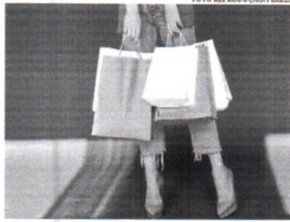
A Copa do Mundo deve impulsionar as vendas de Black Friday neste ano

Em 2021, o Procon registrou denúncias de propaganda enganosa, de promoções falsas em lojas e problemas com compras na internet