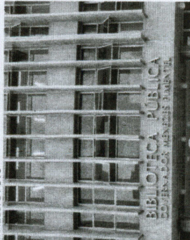
BIBLIOTECA Pública está fechada desde quando Cid Gomes era governador