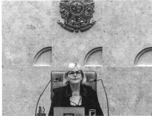
A ministra deixa o comando do STF após um ano ao completar 75 anos

Rosa Weber elogiou ainda a imprensa e o seu papel. "A imprensa livre, isenta e independente é indispensável à democracia", destacou. A ministra destacou ainda que teve a oportunidade de conhecer o país ao visitar presídios, quilombos e terras indígenas. "A partir dos trabalhos desenvolvidos, mais e melhor conhecer