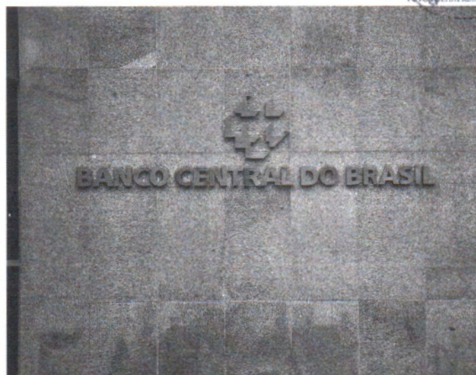
Acordo envolve questões como a comunicação de movimentações atípicas ao Conselho de Controle de Atividades Financeiras

Exoneração. O presidente Lula determinou a exoneração do ex-ministro da Justiça de Bolsonaro e ex-secretário de Segurança Pública do Distrito Federal, Anderson Torres, do conselho fiscal da Caixa Loterias. A ordem veio após os atos de domingo (8), quando a segurança do DF estava sob a responsabilidade de Torres.