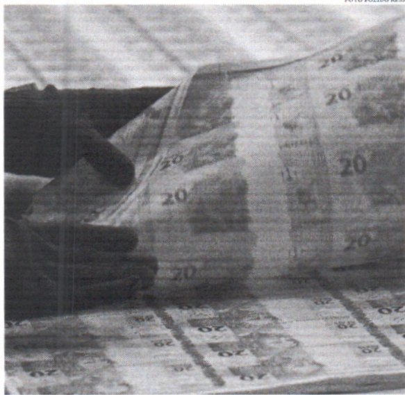
O Brasil deve registrar novo déficit nas contas públicas em 2023, ou seja, não arrecadará o suficiente para pagar despesas

Em 2023, a dívida pública federal deve avançar e ficar entre R$ 6,4 trilhões e R$ 6,8 trilhões, segundo o órgão. Em 2022, esse indicador ficou em R$ 5,95 trilhões. Após os resultados da dívida registrados em 2022, o Tesouro projeta que a dívida bruta alcançará 73,3% do Produto Interno Bruto (PIB) ao final do ano. O crescimento nominal de até 14,3%, após avanço de 6% em 2022, é esperado em um momento em que a taxa básica de juros, a Selic, está em 13,75% ao ano. O Brasil deve registrar novo déficit nas contas públicas em 2023. Isso quer dizer que não arrecadará o suficiente para pagar suas despesas e precisará emitir novas dívidas para bancá-las. "A proposta de um novo arcabouço fiscal balizado pelo nível de endividamento público e a prioridade da agenda política para aprovação de uma reforma tributária em 2023 favorecem a trajetória de endividamento para os próximos anos e, conseqüentemente, a gestão da dívida pública federal", disse o Tesouro. Ainda segundo o órgão,