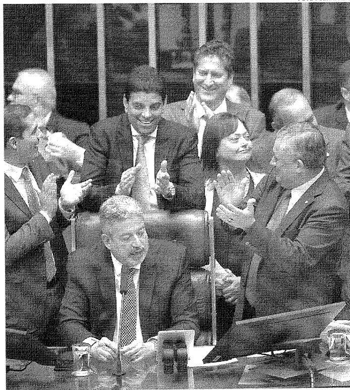
Haddad disse que o governo está buscando equilibrar as contas públicas com justiça social

A vitória do governo na aprovação do novo arcabouço fiscal foi a primeira significativa após a Câmara votar pela derrubada do