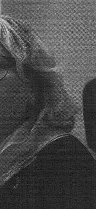
Chanceler alemão Olaf Scholz durante sua visita ao Brasil.