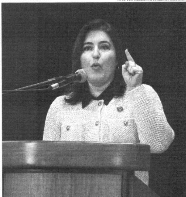
Tebet defendeu revisão dos gastos tributários do país, que ela apontou que podem chegar a R$ 400 bi

A ministra disse isso ao participar do painel de abertura do seminário Reforma Tributária, Seminário de Avaliação e Melhoria do Gasto Público, na sede do Ministério do Planejamento. Também participaram